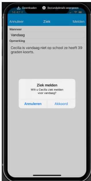
Scherf 1 Scherf 2 Scherf 3

Scherf 1: Geef aan of u uw kind voor 'vandaag' of 'morgen' ziek meldt en geef eventueel bij 'Opmerking' een toelichting. Als alles correct is ingevuld klikt u op 'Gereed' en rechtsboven op 'Melden'